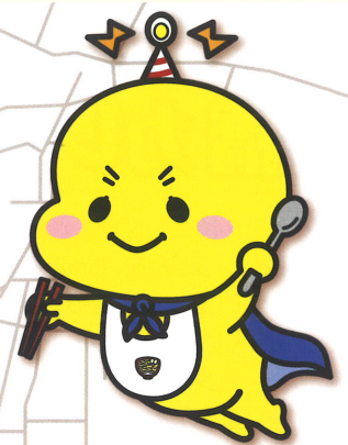
豊橋カレーうどん マスコットキャラクター Yeah!Rō イエローくん