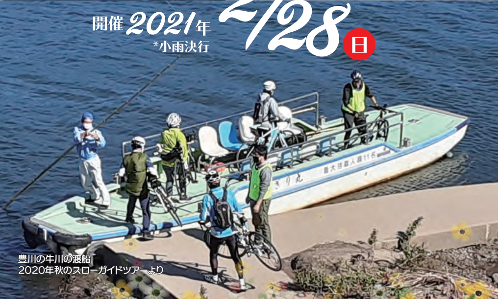
豊川の牛川の渡船 2020年秋のスローガイドツアーより