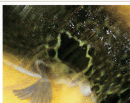
天然とら河豚コース ¥13,200~ (9コース材料 ※天候等のため、荒天時の場合は価格変更もございます)

地元が誇る旬の食材を使った寿司と京風懐石が絶品。夏はハモ、冬はフグ等の上品な味を最大に引きだす料理人の技術は正しく名店割烹。夜コース ¥6,600~ (サ別)