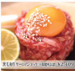
黒毛和牛サーロインユッケ(※保熟所公開) ¥2,409

焼肉 塩すだち 黒毛和牛の肉質にこだわり、本当に美味しい部位だけを品揃えました。契約農家直送の辛味大根と一緒に楽しみ下さい。全席個室の焼肉店です。