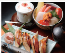
穴子握り4ヶと海鮮丼 ¥2,100

創業明治40年。渥美半島や三河湾など新鮮な海の幸をはじめ厳選したネタで握る味わいに定評がある老舗です。