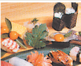
穴子寿司(タレ又は塩) ¥2,640

近海で捕れた天然魚介類が、いつも豊富。寿司の他、お料理もいろいろ用意しています。駅から徒歩約4分。お勧めは、おまかせ握り寿司。