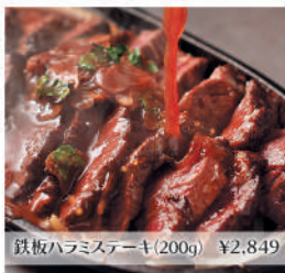
鉄板ハラミステーキ(200g) ¥2,849

鉄板 おいでん こだわりのホットソースで頂く肉厚ステーキ。愛情を込めて作る出汁とソースが決め手のもんじゃ焼き！鉄板を囲んでワイワイとお楽しみ下さい。