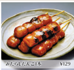
みたらしだんご1本 ¥129

餅菓子処 大正軒 だんご、ぜんざい等、餅菓子が楽しめる明治9年創業の老舗になります。たまり醤油の秘伝ダレをつけ焼き上げるみたらしだんごは格別美味。