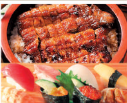
肉厚ひつまぶし1本 ¥5,000

創業1923年。主に活き肉厚豊橋鰻を中心とした日本鰻と地魚・全国の鮮魚を毎日仕入れ、捌いて提供するこだわりの店です。地酒・全国酒も豊富に取り揃えております。