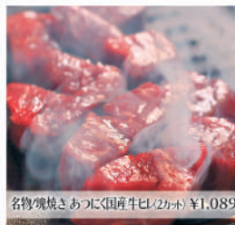
名物焼肉あつにく(国産牛ヒレ2カット) ¥1,089

あつにく 本店 職人が丁寧に仕込んだ熟成ガーリックソースを合わせて焼く焼肉は他では食べられない至福の味。ヘルシーな赤身やヒレ焼肉を豪快にお楽しみください。