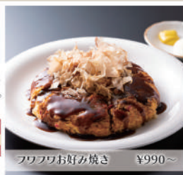
フワフワお好み焼き ¥990~

鉄板焼 とらのこ 名古屋の名店「かちやぐり屋」を独立。五感を刺激するオープンキッチンで地元野菜料理をはじめ、ふわふわお好み焼きは全国でリピーター急増中！お1人様OK！接待可。個室は要相談。