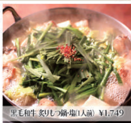
黒毛和牛炙りもつ鍋(1人前) ¥1,749

丁寧に仕上げた名物のもつ鍋や、純国産の馬刺し、こだわりの料理を豊富なドリンクと一緒に個室で堪能。2名~使用できる小個室完備。