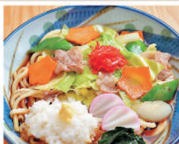
野菜炒め(うどんorそば) ¥800

豊橋の中心地に本店を構え、のれん分けした店は10店舗。各店ともにメニューに個性がある。本店には昔ながらの中華そばやオムライスも。