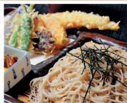
名代「あなご天ざる」 ¥1,630

創業半世紀を過ぎました。三世代四世代で通って下さる地域の皆様、近隣企業のビジネスパーソン、観光や出張でお越しの全国の皆様でにぎわっています。地の食材と黄金のだしのハーモニーが最強。