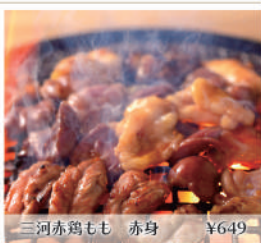
三河赤鶏もも 赤身 ¥649

柔らかく味わい深い三河赤鶏にこだわった鶏焼肉。10種以上の部位をお好みの味で。名物水炊きもおススメ! カウンター席や個室も完備。