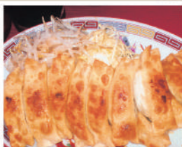
餃子(お持ち帰り) ¥410〜 / (店内) ¥420〜

豊橋駅西口から徒歩2分の至近距離。豊橋を風靡した餃子専門店。餃子は大きくてお値打ち。香ばしさ1番の焼きたてをぜひどうぞ。