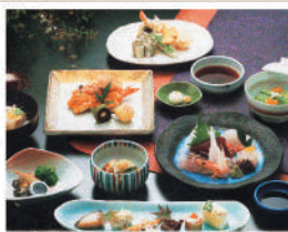
お弁当 ¥1,000〜 会席料理 ¥5,000〜 (税別)

鮮度の良い魚をベースに料理を提供いたします。茶懐石、会席料理、海鮮料理、ふく料理、おせち、お弁当、お寿司など、仕出し出張パーティー料理も致します。すべて要予約です。