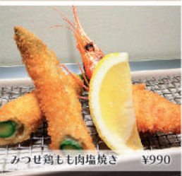
みつせ鶏もも肉塩焼き ¥990

旬彩串揚 葉隠亭 (ハガクレテイ) 豊橋駅から徒歩5分の広小路通りにある串揚げ専門店。三河の旬食材を中心に、油・パン粉にこだわったワンランク上の味が魅力です。