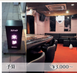
3名以上で 瓶ビール1本サービス 予算 ¥3,000~

引き継ぎ5年目の店です。カラオケはDAMのAIで音響良く楽しくカラオケが楽しめます。週末は美晴ママの娘も居ます。