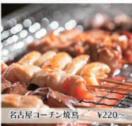
名古屋コーチン焼鳥 ¥220~

落ち着いた空間の個室とカウンターで、とことんこだわった地鶏の焼鳥や鍋。そして日本酒や焼酎もご堪能ください。ご予算等ご対応致します。