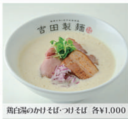
鶏白湯のかけそば・つけそば 各¥1,000

豊橋駅前の市電沿いにある、国産小麦と店内自家製麺にこだわったラーメン屋。3日かけてつくる鶏白湯はすっきりコクと香りがあふれるスープになっていてオススメです！