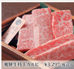
飛騨牛特上カルビ ¥3,297(税込)

飛騨牛やこだわりの和牛を楽しむ個室空間は無煙コースター完備。他にも大盛り、ビーリーフなど上質食材を楽しめます。