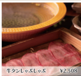
牛タンしゃぶしゃぶ ¥2,508

全席個室で楽しめる牛タン料理や旬の味覚をお楽しみいただけます。お仕事帰りやカジュアルなご接待などにご利用ください。日替りのお刺身メニューもありお楽しみいただけます。