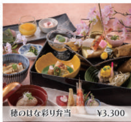
穂のはな彩り弁当 ¥3,300

旬の食材を織り込んだ季節の会席や、地元ブランド牛のすき焼き膳などをご用意しております。大切な方のご会食や接待、お顔合わせや結納など、様々なシーンにもご利用いただけます。