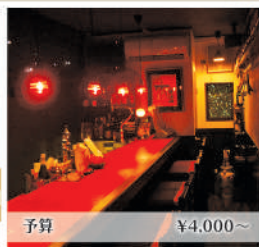
ビール1本 or 生ビール1杯 予算 ¥4,000~

大人っぽさを感じさせるカウンターで、おいしいお酒とともにスタッフと楽しい会話が楽しめる。ゆっくり落ち着いた都会の隠れ家。