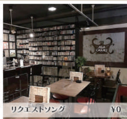
リクエストソング ¥0

多彩なジャンルの心地よい音楽が流れる中、お1人様でもゆっくりとお酒を嗜む空間。日常から離れたホッと一息つきませんか?