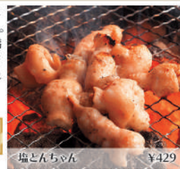
塩とんちゃん 1皿サービス ¥429

鮮度にこだわった名物「塩とんちゃん」は本当においしい。ビールとの相性も抜群。豊橋に来たら必ずお立ち寄り下さい。お1人様でも気楽に入れる焼肉居酒屋です。