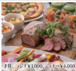
予算 ランチ¥3,000、ディナー¥4,000

西洋料理をベースに、ホテル自慢の料理を食べ放題にてお楽しみいただけます。駅直結で、ご家族やご友人、会社やお仲間との大人数でのお集まりにもお気軽にご利用いただけます。