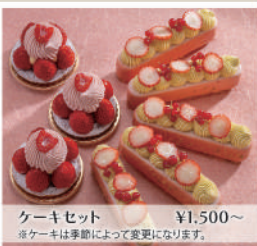
ケーキセット ¥1,500~ ※ケーキは季節によって変更になります。

居心地の良さにこだわった店内は、待ち合わせや喫茶、ビジネス利用、夜はバーとして幅広くご利用いただけます。ケーキやアフタヌーンティーの他、サンドウィッチなどの軽食もご用意しております。