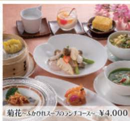
菊花ふかひれスープのランチコース ¥4,000

ふかひれの姿煮込みや北京ダックなどの本格コースはもちろん、人気の麻婆豆腐や点心、オーダーバイキングもおすすめ。駅直結でご会食やご接待など、ビジネスシーンの利用にも便利です。