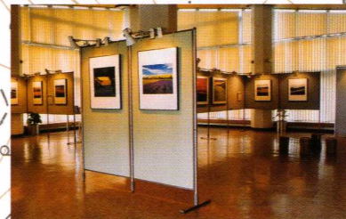
茶臼山高原の美術館

写真家・前田真三氏の奥三河に題材を得た名作・代表作を常設展示し、一部スペースをフリーギャラリーとして一般に提供しています。