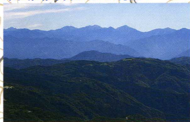
茶臼山山頂からの眺望

愛知県最高峰茶臼山と県内第2位の高峰萩太郎山の頂上をめくり、茶臼山高原を周遊するルートです。山頂からの素晴らしい眺望は、南アルプス連峰を見ることができます。