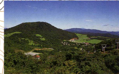
萩太郎山からの眺望

山頂からは茶臼山やのどかな高原風景が一望でき、天気の良い時は、アクトタワー(浜松市)や、名古屋市の夜景までも見ることができます。