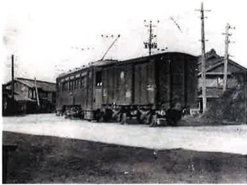
道路上を走る渥美線 小池・師団口(現在の愛知大学前)間 1930(昭和5)年ごろ