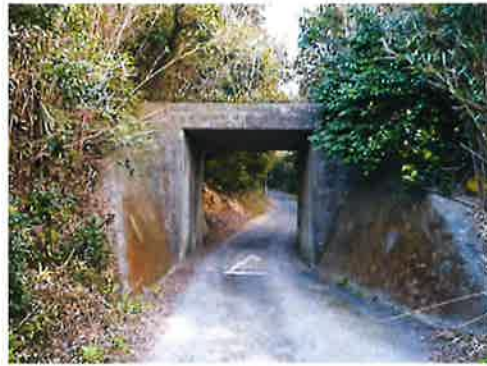
回による渥美線建設工事の遺構である石神町に残るコンクリート橋 現在