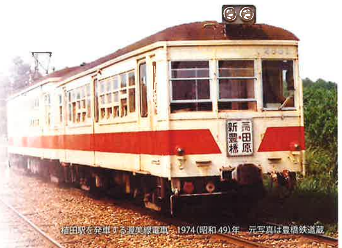
田原駅を発車する渥美線電車 1974(昭和49)年

また、90年前に計画された半島の先端まで建設するはずだった「まぼろしの渥美線」の過去と現在も取り上げます。この展覧会によって、お客様に地域の鉄道の新たな一面を発見する機会にしていただければ幸いです。