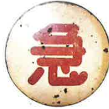
急行マーク(列車種別標) 〔個人蔵〕