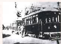
開業当時の市内電車

◆豊橋市美術博物館 「豊橋鉄道100年 市電と渥美線」 会期 7月13日(土)~9月16日(月・祝)