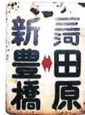
行き先方向板 〔個人蔵〕