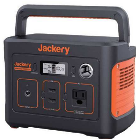
3 「Jackery」ポータブル電源 (67200mAh・240Wh)