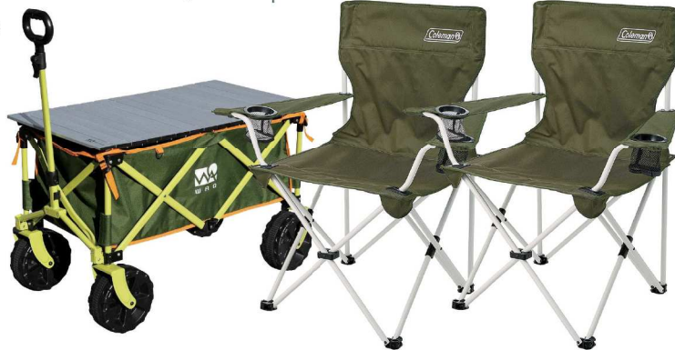
4 「WAQ」キャリーワゴン(耐荷重150kg ファンタッチ収束式 106L) 「Coleman」リゾートチェア(オリーブ)×2脚