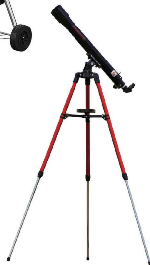
5 「スコープテック」 ラプトル60 天体望遠鏡セット