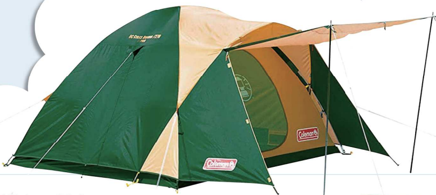
1 「Coleman」テント BCクロスドーム 270(グリーン 4~5人用)

当選された方は下記の中から好きなものをお選びいただけます。*賞品が品切れの場合は同等品となりますのでご了承ください。