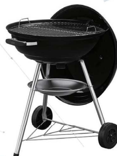
2 「Weber」 コンパクトケトル(57cm)